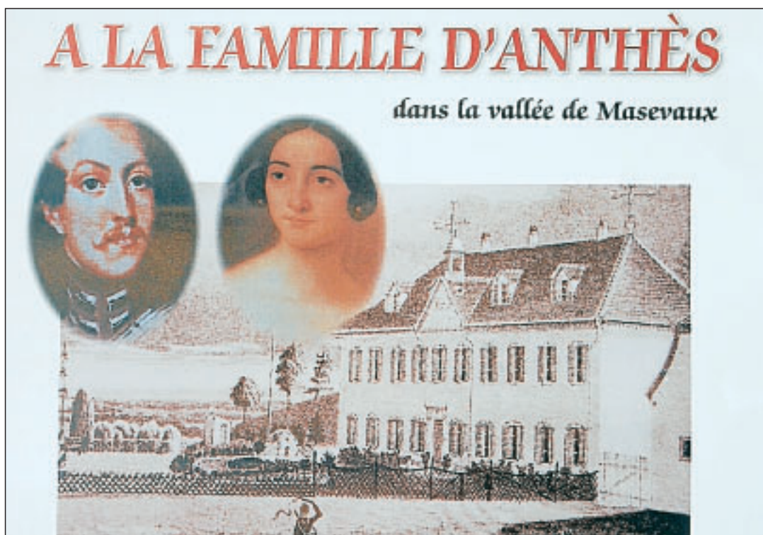
La famille d'Anthès a profondément marqué la vie dans la vallée de la Doller.